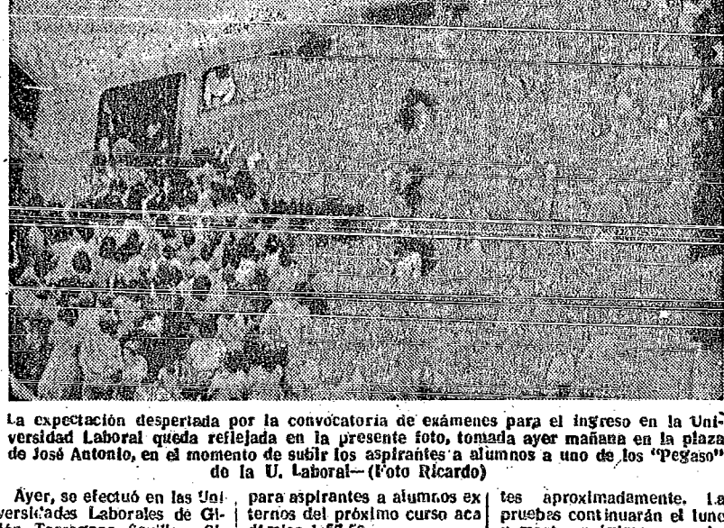
La expectación despertada por la convocatoria de exámenes para el ingreso en la Universidad Laboral queda reflejada en la presente foto, tomada ayer mañana en la plaza de José Antonio, en el momento de subir los aspirantes a alumnos a uno de los "Pegasos" de la U. Laboral.

Se presentaron a las pruebas 367 muchachos de nuestra ciudad. La convocatoria ha suscitado gran expectación e interés en la clase trabajadora.